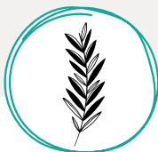
Tailles de haies, brindilles