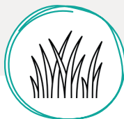
Tontes de pelouse