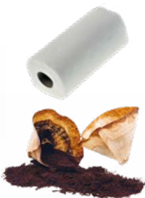
Marc de café et filtres, sachets de thé, essuie-tout