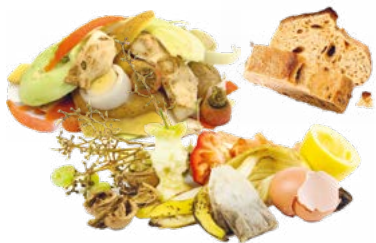
Épluchures, pain, coquilles d'œuf