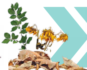
Branchage, broyat, végétaux, feuilles