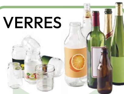
Bouteilles, pots et bocaux en verre Sans bouchon, sans couvercle

À déposer dans les bacs verts , points d'apport volontaire ou en déchèterie