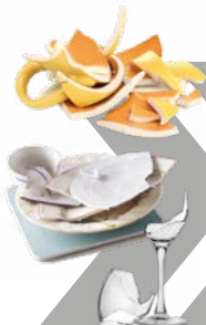
Vaisselle et verres cassés

À déposer dans les bacs gris , ou dans les points d'apport volontaire