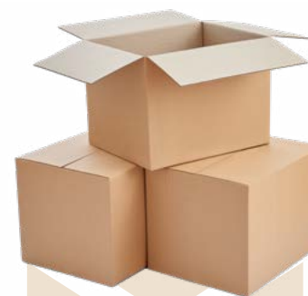
Gros cartons : réfrigérateur, TV, meuble, colis