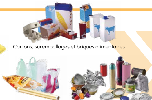
Cartons, suremballages et briques alimentaires