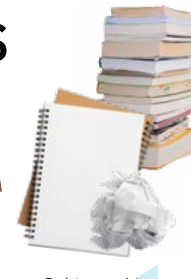
Cahiers - Livres Papier froissé ou déchiqueté

À déposer dans les bacs bleus , points d'apport volontaire ou en déchèterie