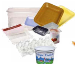
Pots, boîtes et barquettes en plastique