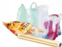
Sacs, sachets et films en plastique