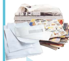
Journaux - Magazines Courriers