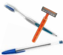
Objets en plastique